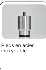
Pieds en acier inoxydable