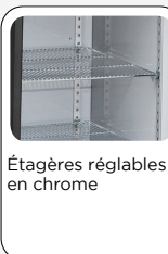
Étagères réglables en chrome