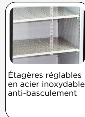
Étagères réglables en acier inoxydable anti-basculement