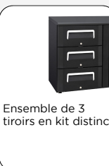
Ensemble de 3 tiroirs en kit distinct