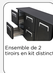
Ensemble de 2 tiroirs en kit distinct