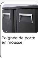
Poignée de porte en mousse