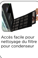
Accès facile pour nettoyage du filtre pour condenseur