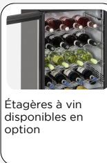
Étagères à vin disponibles en option